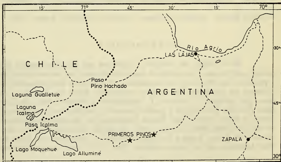
Fig. 1.- Localidades donde fueron capturados el holotipo y paratipos de L. coeruleus están señalados con estrellas.

A un atento examen, diferencias significativas con las formas hasta ahora descritas de Liolaemus tenuis , permitieron reconocer la población neuquina de Primeros Pinos como un taxón propio, que estimamos como categoría específica. Objeto de este trabajo, es pues, la descripción de la nueva especie y su comparación con las otras formas chilenas del grupo.