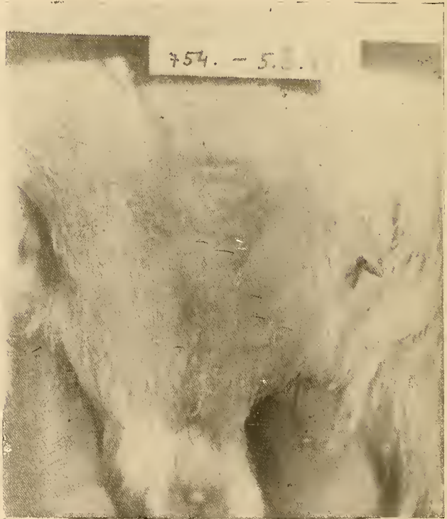
Fig. 2.—Cuy hembra adulta fuera de la preñez. Se constata que los pezones son mucho más desarrollados que en el macho.

Pettinari . Pero yo encontré que todo el desarrollo del aparato mamario en la hembra con ingerto, es diferente del que se observa en el macho hiperfeminizado. No hay en la hembra un desarrollo tan rápido, no hay un celo continuo ; en la hembra con un ingerto ovárico continúa un ciclo sexual, aunque muy irregular. Estudiando el ingerto ovárico de la hembra en el cuy, se constata que