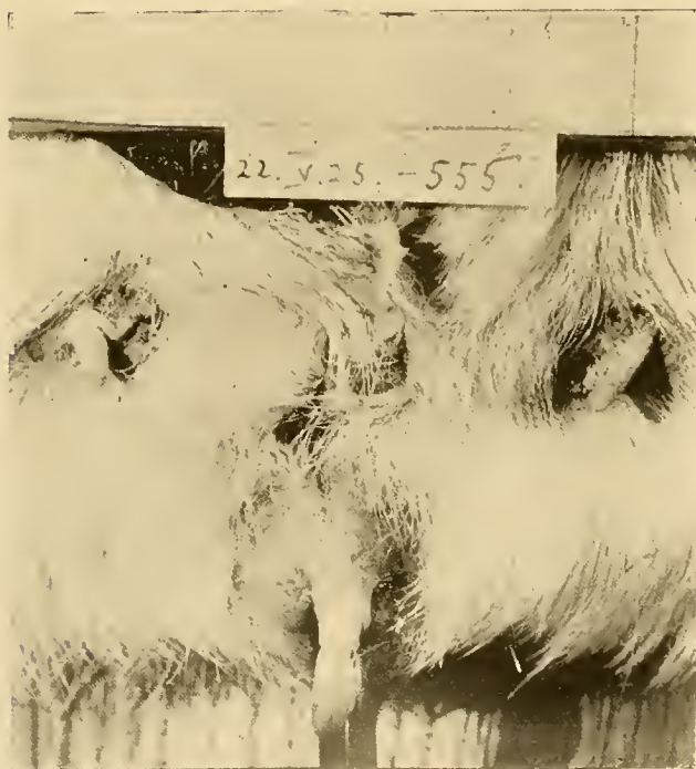
Fig. 3.—Cuy macho castrado hiperfeminizado por un injerto ovárico. Hipertrofia enorme de los pezones. Cinco meses después de hacerse el injerto. Comp. Fig. 1 y 2.

La diferencia en la reacción del macho y de la hembra al injerto ovárico, revela que en el organismo fuera de las glándulas sexuales existen factores que regulan el comportamiento de estas glándulas, factores que son específicos para cada sexo . Por el momento no podemos decir en donde se localizan estos factores. Es esto un conjunto de problemas que aún debe ser estudiado experimentalmente.